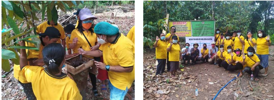
Gambar 1. KUPS HHBK Henda Sejahtera mengolah madu kelulut

ekonomis dari produk HHBK yang dihasilkan. Dengan meningkatnya nilai ekonomi produk maka dapat meningkatkan pendapatan masyarakat.