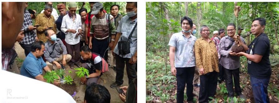
Gambar 2. Pelatihan Pengolahan produk HHBK (Tanaman Porang)