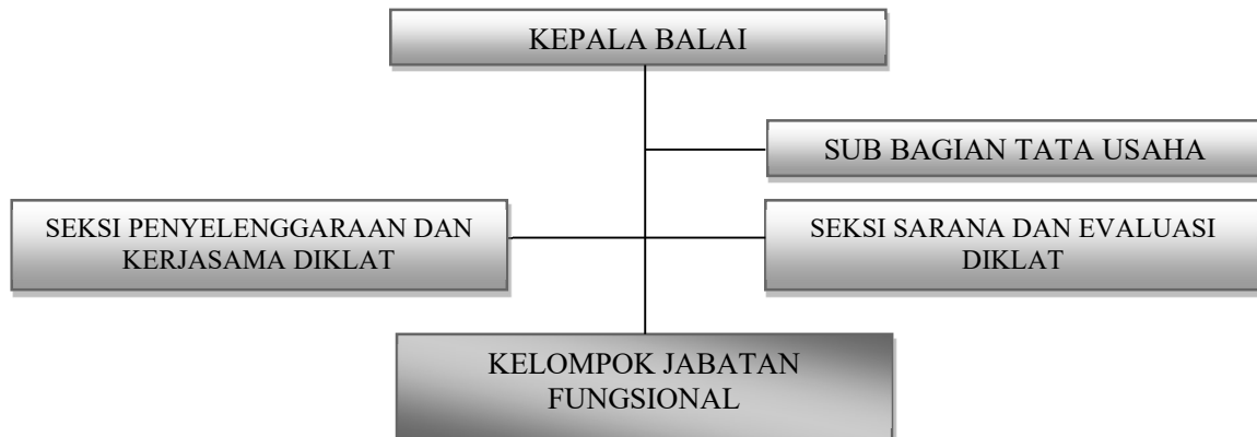
Gambar 1. Struktur Organisasi Balai Diklat LHK Kupang

Adapun tugas masing-masing seksi atau sub sesuai struktur diatas yaitu: